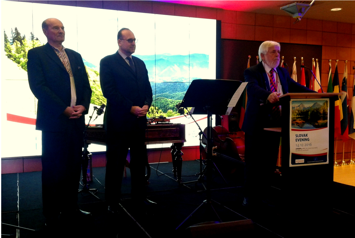
Predseda EHSV Dassis Georges počas Slovenského večera

Slovenská republika končí svoje polročné predsedníctvo v Rade Európskej únie. Bolo to naše historicky prvé Predsedníctvo, ktoré bolo určené rozhodnutím Rady z 1. januára 2007. Počas nášho šesťmesačného Predsedníctva sme boli zodpovední za program rokovaní, ale najmä za legislatívu a politické rozhodnutia a kompromisy.