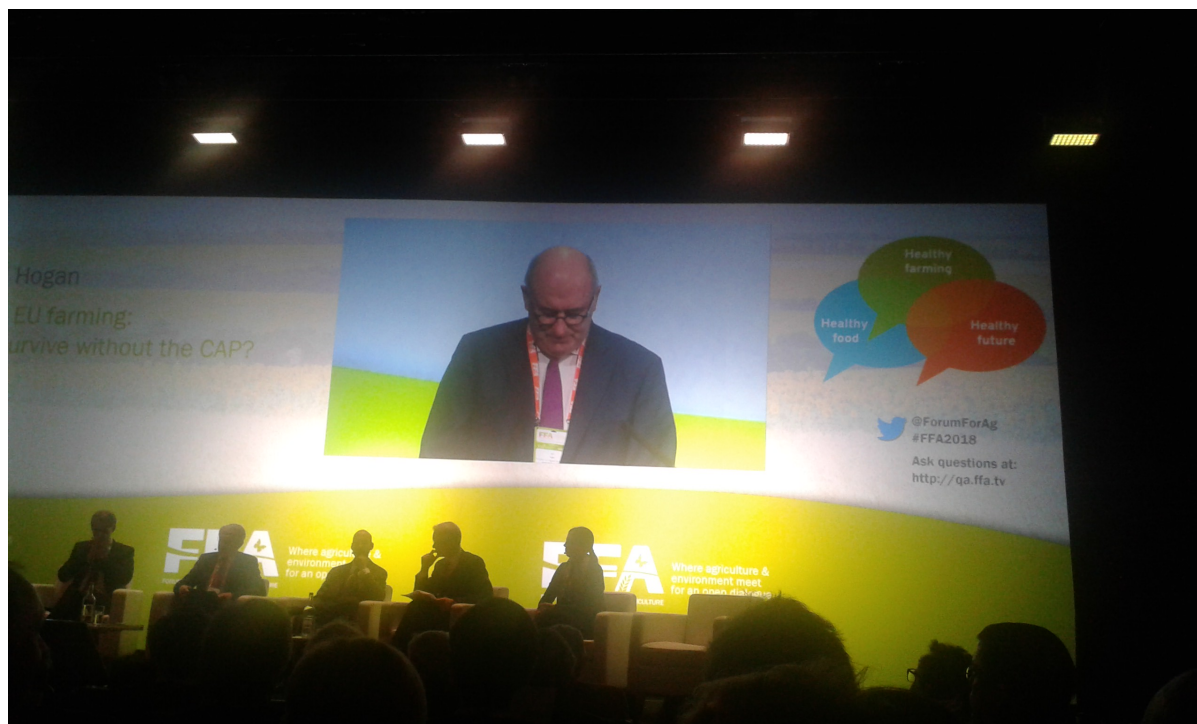
Vystúpenie eurokomisára Phila Hogana

Tohtoročné podujatie „Fórum pre budúcnosť poľnohospodárstva“ (skratka podujatia je FFA, ktorá vychádza z anglického názvu podujatia Forum for the Future of Agriculture), ktoré každoročne prebieha v Bruseli, sa nieslo v znamení zdravia. Jedenásty ročník podujatia vyzýval k zdravému životnému štýlu prostredníctvom poľnohospodárstva a potravinárstva. Devätnásť vystupujúcich rečníkov a dvaja moderátori sa zamerali na trvalodržateľné potravinové systémy, zdravé životné prostredie, budúcnosť poľnohospodárstva a poľnohospodárskej politiky a prostredníctvom nej na budúcnosť potravinárstva. Počas diskusií a vystúpení účastníkov odzneli aj príklady z praxe.