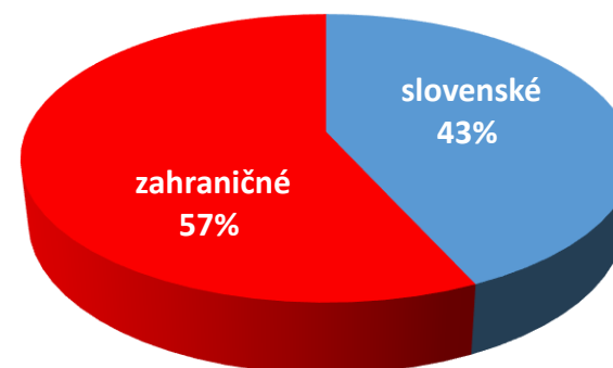
Podiel zastúpenia mliečnych výrobkov na pulkoch v OR